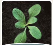
Knautie des champs